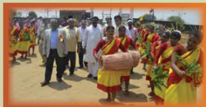
Campus Cultural Activity