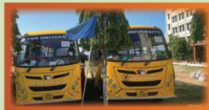
Pickup & Drop Facility